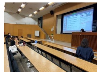
1号館120教室をPC接続のための部屋として開放

〈高校の先生方へ〉高校の先生方から引き継ぎ、入学した学生一人ひとりが充実した大学生生活を送れるよう支援できる交流会を目指しました。高大連携室に連絡するよう卒業生に伝えていただいたことに改めて感謝いたします。